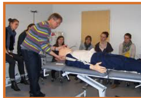
Simulatorundervisning på OUH

I Odense blev der afholdt simulatorundervisning i hjernedødsundersøgelsen, med løbende gennemgang af vigtige kliniske pointer i samtalen med de pårørende, samt en særlig dag om jura, med fokuseret gennemgang af E-lærings kurset om jura og organdonation.